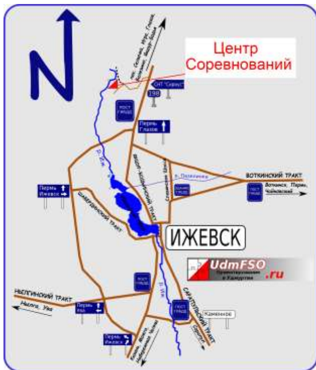
Схема проезда к центру соревнований:

01.06-02.06 2013 г., г. Ижевск, 21 км. Як-Бодьинского шоссе.