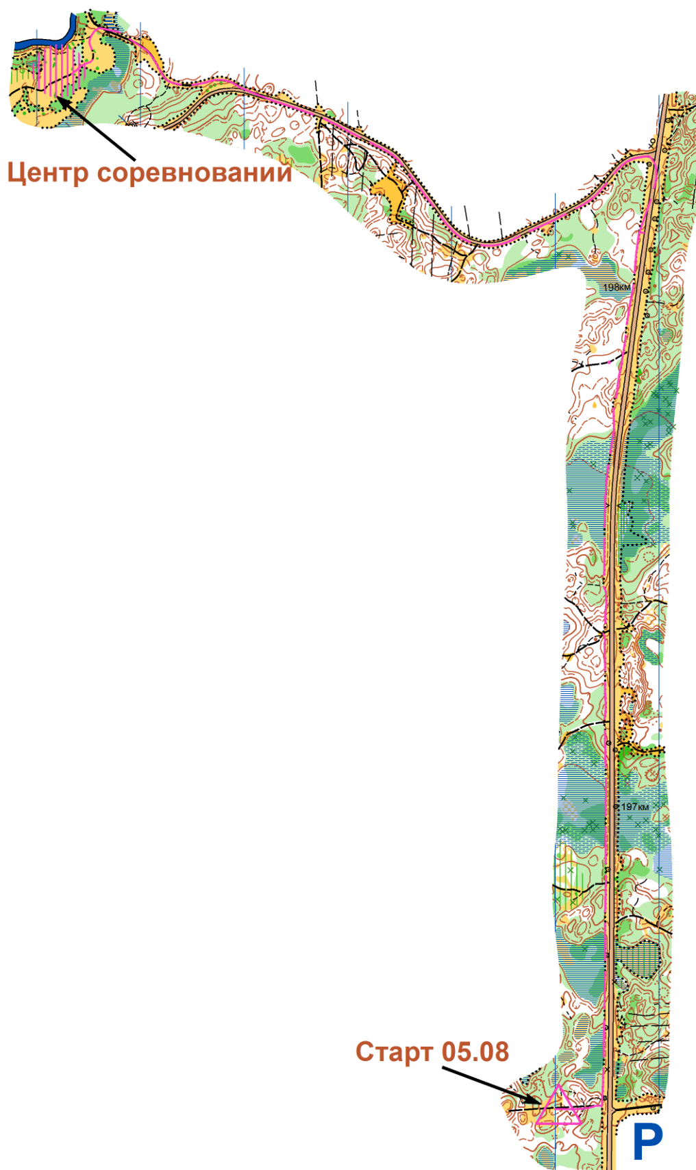
Схема движения на старт:

Карта цветная, отпечатана на бумаге Lomond струйным принтером, формат карты А4. Масштаб карты 1:7500 для всех групп, кроме М,Ж-10,12, для данных групп масштаб карты 1:5000, высота сечения рельефа 2,5 м. Карта подготовлена в 2009-2010г. г. Яшпатовым Г.Т., откорректирована 2016-2017г.г. Легенды впечатаны в карту. Карты не герметизированы, пакеты будут предоставлены на старте. Аварийный азимут на Восток (90) до шоссе, далее на север до старта. Контрольное время 2ч. 00мин.